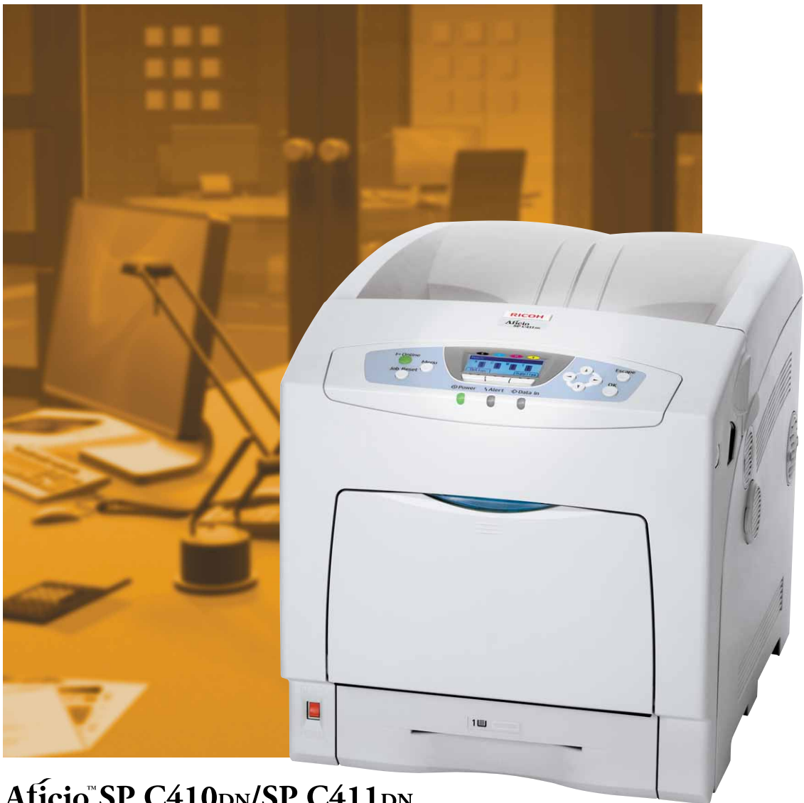
Aficio™ SP C410DN/SP C411DN

Alta qualità e grande convenienza nella stampa a colori